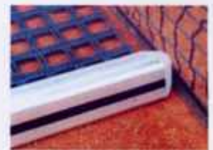
Die speziellen Kopfstücke verhindern ein Hängenbleiben am Tennisnetz