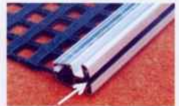
Gehärtete Stahleinlage (Pfeil) gegen Verzug des Balkens